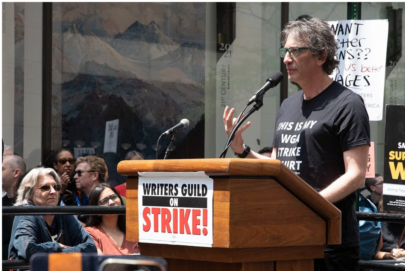
Писатель Нил Гейман.

далеко не только во время пандемии: сервис дает возможность читать книги людям, которые по каким-либо причинам не могут посещать библиотеки. Это уже не говоря о сохранении текстов на поколения вперед.