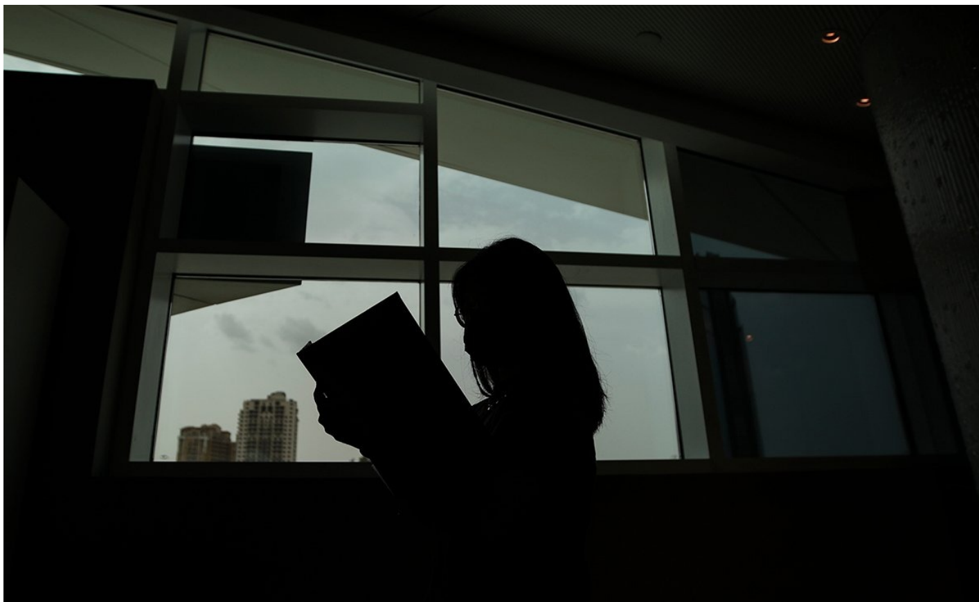
Посетитель библиотеки читает книгу.

Компания иронизирует над тем, что по требованию правообладателей из Open Library убрали антиутопические романы «1984» и «451 градус по Фаренгейту» — в этих произведениях государства сжигали неудобные книги. О дальнейших шагах компании пока ничего неизвестно.