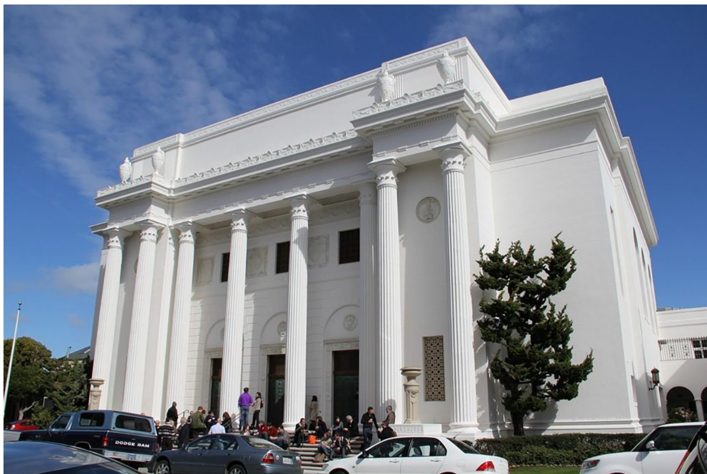
Здание организации Internet Archive.

National Emergency Library прекратила работу 16 июня 2020 года. Internet Archive попросил издателей отозвать иск и решить конфликт мирно. Однако даже это не убедило компании прекратить разбирательства.